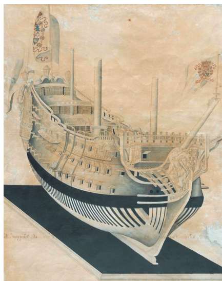
Navío de tres puentes (N. Berlinguero, 1773), del Archivo Histórico de la Armada.

La mayoría son manuscritos, están realizados en el siglo XVIII y la primera mitad de la centuria siguiente, y reflejan el impulso que la nueva dinastía Borbón dio a la modernización de la Armada, en la que la construcción naval fue un pilar