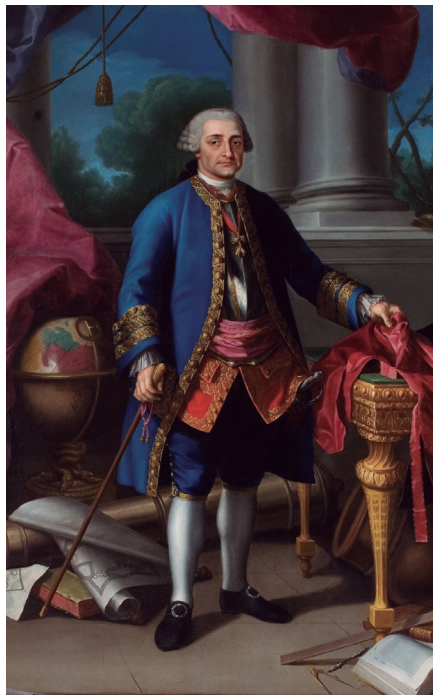
Óleo sobre lienzo de Ramón Bayea (1768-1770)