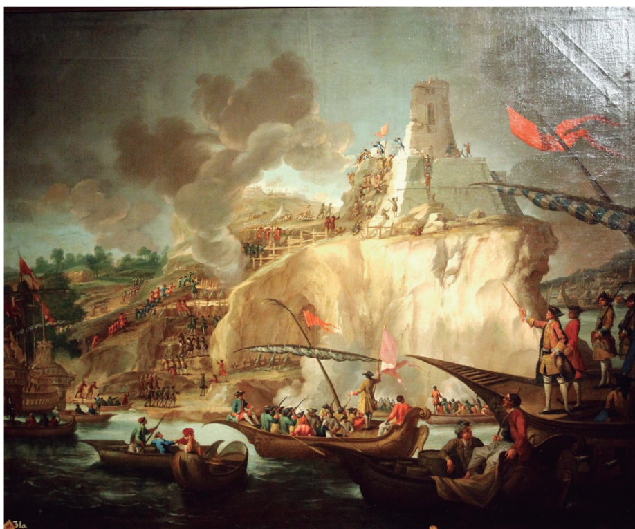
Asalto inglés al Castillo del Morro (Cuba), episodio de la Guerra de los Siete Años, juzgado por Aranda y evocado en la muestra sobre Carlos III (M. Arqueológico, 2017).

Siempre se opuso a una guerra para la que consideraba que el Ejército español no estaba preparado y de la que nuestro país no obtendría ventaja alguna. Enfrentado con el monarca por estas opiniones, fue destituido en 1793 y reemplazado por Manuel Godoy, desterrado, procesado y encarcelado.