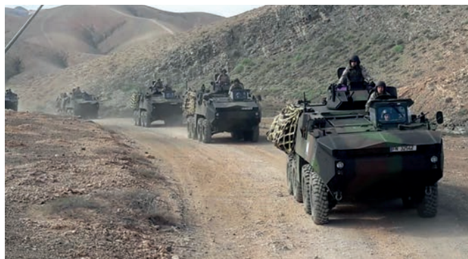
Lanchas del Grupo Naval de Playa trasladan la fuerza a tierra. A la dcha. columna de vehículos en Fuerteventura.