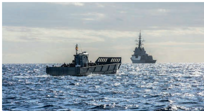
Infantes de marina españoles y marines norteamericanos desembarcan en la Sierra del Retén el 23 de noviembre.